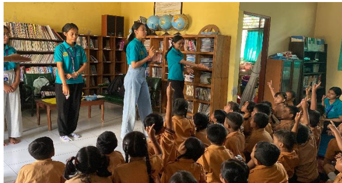
Gambar 1. Diskusi dan Tanya Jawab