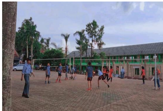
Gambar 5. Penerapan Sila Kelima melalui Kegiatan Ekstrakurikuler Volley

Gambar 4 menunjukkan penghayatan nilai pancasila pada sila keempat yaitu Kerakyatan yang dipimpin oleh Hikmat Kebijaksanaan dalam Permusyawaratan/Perwakilan. Sila keempat ini mengandung nilai demokrasi, pelaksanaan musyawarah untuk mencapai mufakat (Ardhani et al., 2022). Penerapan sila keempat di SMA Negeri 11 Palembang adalah mementingkan musyawarah saat pengambilan keputusan demi kepentingan orang banyak, misalnya saat diskusi pemilihan ketua osis dan perangkat kelas. Pemilihan ketua osis di SMA Negeri 11 Palembang dilakukan secara transparan dan diikuti oleh semua warga sekolah tanpa terkecuali. Ketika terjadi perbedaan pendapat, peserta didik tetap saling menghargai dan mencari bersama jalan keluarnya serta tidak memaksakan pendapatnya kepada orang lain. Contoh lainnya adalahh peserta didik berpartisipasi aktif ketika diskusi di kelas, peserta didik mengerti etika berdiskusi di kelas seperti mendengar pendapat temannya dan memberikan pendapat dengan cara yang baik.