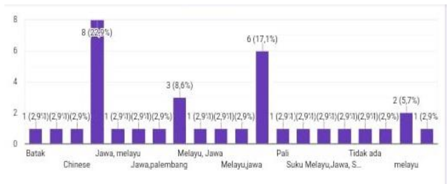
Diagram 1. Keberagaman Etnik (Suku) Peserta Didik

SMA Negeri 11 Palembang adalah salah satu SMA Negeri yang berada di kota Palembang dengan terakreditasi A “sangat baik”. SMA Negeri 11 Palembang terletak di Jl. Inspektur Marzuki No. 2552 Siring Agung, Ilir Barat I Kota Palembang, Provinsi Sumatera Selatan. Penghayatan dan penghargaan terhadap Bhinneka Tunggal Ika sebagai identitas manusia Indonesia sudah diterapkan di SMA Negeri 11 Palembang. Hal tersebut dapat dilihat dari observasi yang dilakukan di kelas X6 SMA Negeri 11 Palembang yang menunjukkan adanya berbagai macam keberagaman di lingkungan sekolah seperti keberagaman suku, agama, dan latar belakang sosial ekonomi peserta didik. Keberagaman suku di kelas X6 dapat dilihat pada tabel berikut.