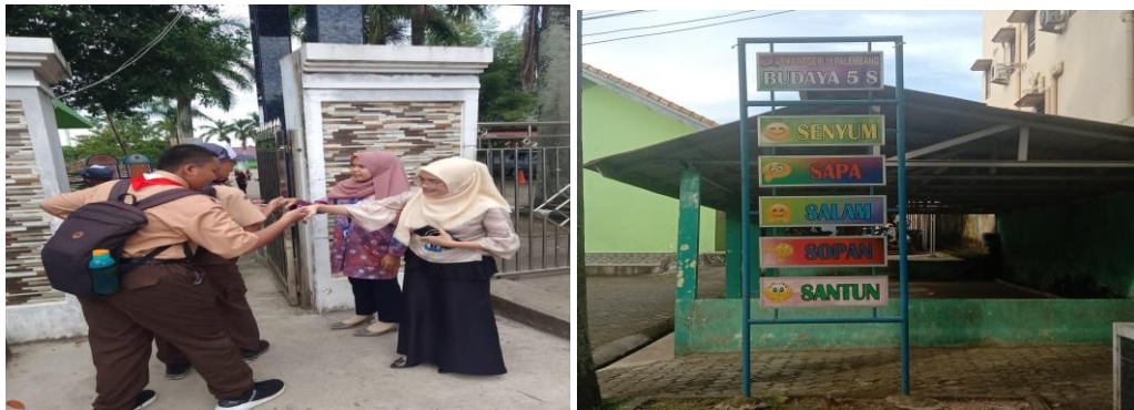
Gambar 2. Penerapan Sila Kedua melalui Kegiatan Budaya 5S dan Terdapat Papan Budaya 5S

Gambar 2 menunjukkan pengimplementasian nilai pancasila pada sila kedua yang berbunyi Kemanusiaan yang Adil dan Beradab. Sila kedua memiliki makna tentang penghormatan terhadap orang lain meskipun terdapat perbedaan yang beragam. Selain itu, sila kedua ini memiliki arti bahwa tingkah laku dan keadaan sikap moral manusia berdasar pada potensi hati nurani manusia yang berhubungan dengan norma dan kebudayaan (Pusdatin, 2021). Pengimplementasian nilai pancasila pada sila kedua di SMA Negeri 11 Palembang adalah peserta didik dan guru menerima serta menghargai perbedaan yang ada di kelas seperti perbedaan suku, agama, maupun ras. Peserta didik juga dibiasakan untuk menerapkan budaya 5S (Senyum, Sapa, Salam, Sopan, dan Santun) saat memasuki kawasan sekolah atau bertemu dengan bapak/ibu guru sebagai bentuk perwujudan manusia yang memiliki akhlak baik.