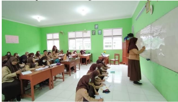
Gambar 4. Penerapan Sila Keempat melalui Kegiatan Diskusi di Kelas

Penghayatan terhadap nilai pancasila pada sila ketiga ditunjukkan melalui pelaksanaan kegiatan upacara bendera yang diikuti oleh seluruh warga sekolah setiap hari senin di lapangan SMA Negeri 11 Palembang. Upacara juga dilakukan pada hari-hari penting seperti hari sumpah pemuda, hari guru, dan lainnya. Pelaksanaan upacara dilakukan sebagai upaya untuk menciptakan jiwa nasionalisme peserta didik dan menanamkan cinta tanah air. Peserta didik menggunakan baju adat pada hari tertentu dan memakai baju batik pada hari kamis sebagai bentuk cinta tanah air dan warisan budaya Indonesia. Penghayatan lainnya juga dapat dilihat pada pelaksanaan pembelajaran di mana saat kegiatan diskusi berlangsung peserta didik saling bertukar informasi dan tidak terjadi permusuhan antar peserta didik saat pelaksanaan kegiatan classmeeting .