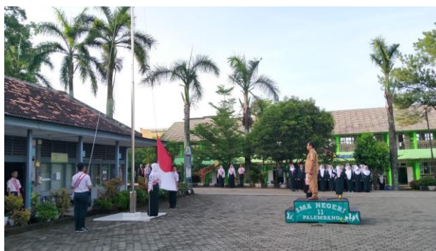
Gambar 3. Penerapan Sila Ketiga melalui Kegiatan Upacara Bendera Setiap Hari Senin

Penghayatan sila kedua yang lainnya di SMA Negeri 11 Palembang adalah peserta didik membentuk kelompok belajar di kelas secara heterogen tanpa melihat perbedaan yang ada, guru telah semaksimal mungkin memenuhi apa yang menjadi hak dan kewajibannya sebagai seorang pendidik dalam proses pembelajaran dan peserta didik juga mendapatkan haknya berupa pembelajaran yang disampaikan oleh guru serta telah mematuhi tata tertib yang ada di SMA Negeri 11 Palembang. Sikap positif lainnya sebagai cerminan perwujudan sila kedua adalah antar warga sekolah baik guru, TU, satpam, dan pegawai lainnya saling menghormati tanpa melihat jabatan yang mereka punya.