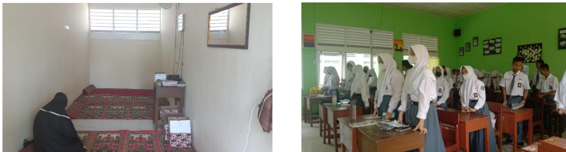
Gambar 1. Penerapan Sila Pertama melalui Kegiatan Sholat di Musholla dan Mengucapkan Salam kepada Guru Sebelum Memulai Pembelajaran di Kelas

Pengimplementasian nilai-nilai Pancasila yang terdapat di SMA Negeri 11 Palembang telah terlihat jelas dengan adanya pengalaman secara nyata yang dilakukan seluruh warga sekolah. Hal ini berdasarkan hasil observasi selama PPL 1 di sekolah. Penerapan dari sila-sila Pancasila termuat dalam setiap sila. Berikut pengamalan dan penerapan nilai-nilai Pancasila yang ada di SMA Negeri 11 Palembang sebagai bentuk penguatan identitas manusia Indonesia.