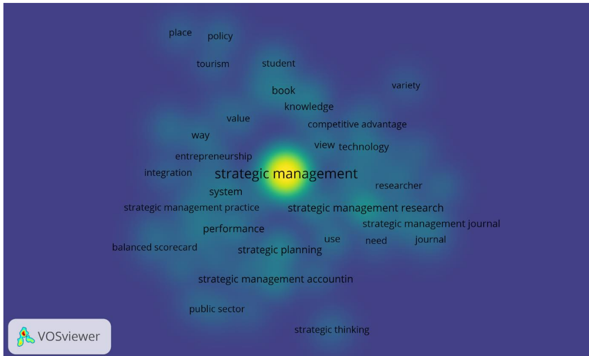
Gambar 3. Visualisasi Densitas